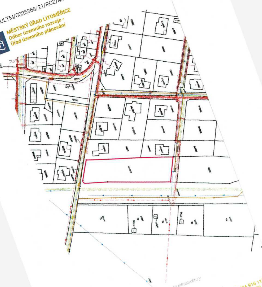
Obrázek 3 orientační zakres hlavních tras technické infrastruktury

Městský úřad Litoměřice Mírové náměstí 15/7 412 01 Litoměřice